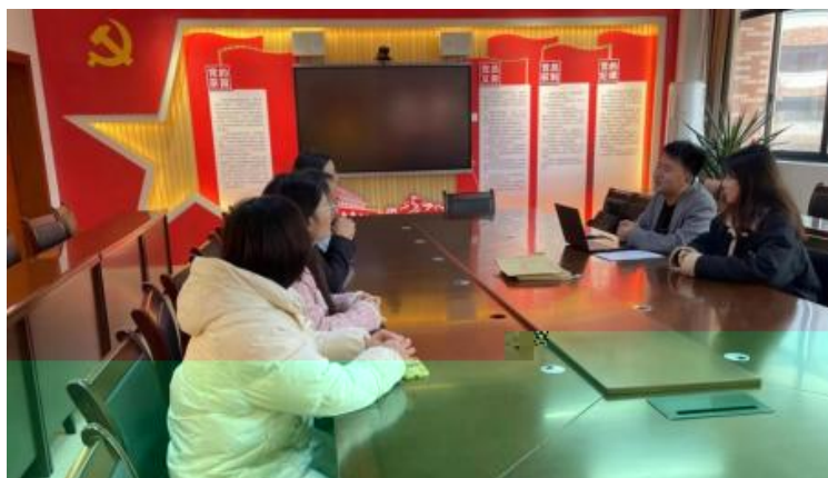
图 企开展学术 交 会