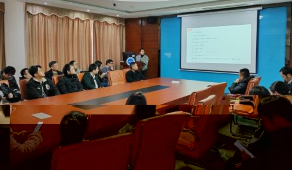
图 员工专业技 培